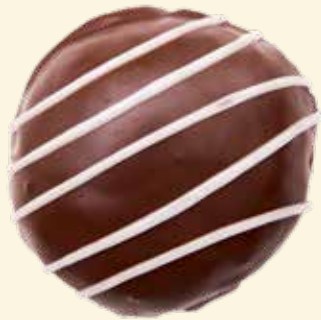
Schokoladen-Kräppel mit selbst gekochtem Schokoladenpudding