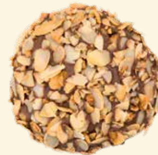
Bienenstich-Kräppel mit selbst gemachter Bayerischer Creme