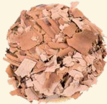
Cappuccino-Kräppel mit Sahnepralinenfüllung aus dunkler Kuvertüre (Canache)