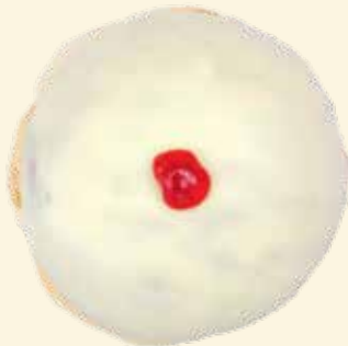
Erdbeer-Kräppel mit selbst gekochtem Erdbeermus