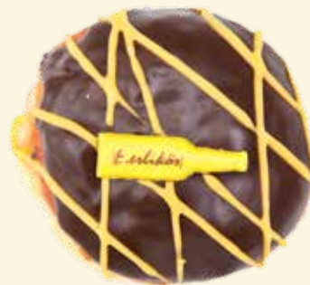
Eierlikör-Kräppel mit selbst gekochtem Vanille- pudding und einem Schuss Eierlikör