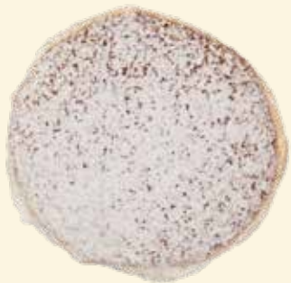
Hagebutten-Kräppel mit Hagebuttenkonfitüre