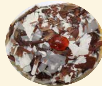
Schwarzwälder-Kräppel mit Kirschfüllung, abge- schmeckt mit Kirschwasser

Reinbeißen und Genießen – Für jeden Geschmack die richtige Variante!