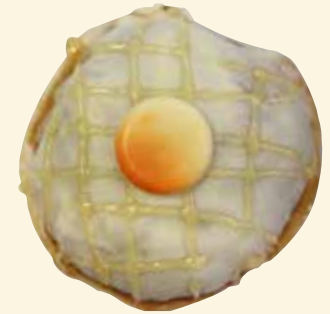
Aprikosen-Kräppel mit selbst gekochtem Aprikosenmus