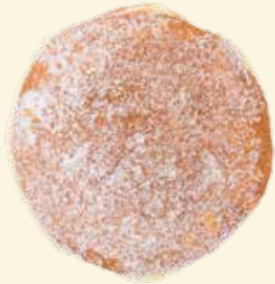
„Klassischer“-Kräppel mit Himbeer-Johannis- beerfruchtfüllung